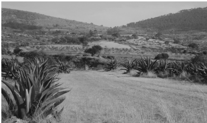
FIGURA 2 EL PAISAJE RURAL Y AGRÍCOLA DE SANTA BÁRBARA

Foto: Eduardo Cerón (diciembre de 2012).