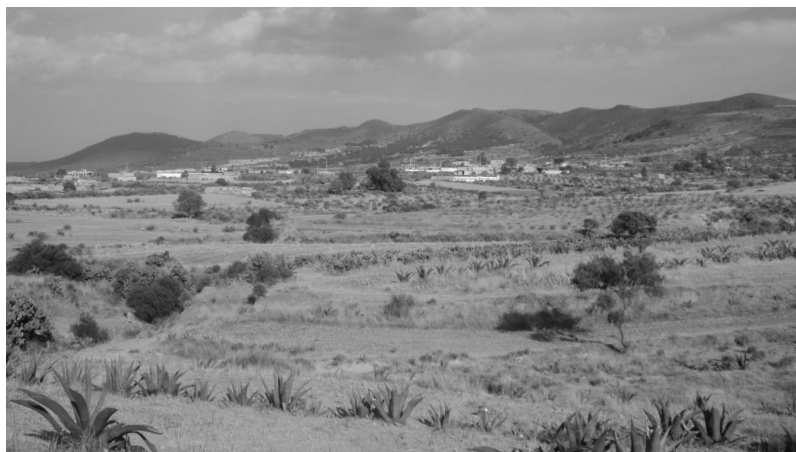
FIGURA 1 EL PAISAJE RURAL DE SANTA BÁRBARA

Foto: Eduardo Cerón (diciembre de 2012).