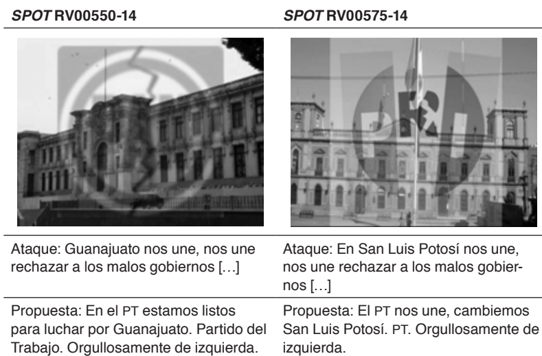
Tabla 7 POSICIONAMIENTO DEL PARTIDO DEL TRABAJO (PT)

En su dimensión simbólica, el PT construye una imagen de partido a la manera de la comunicación publicitaria y los target groups , pues la mención a los estados de Guanajuato y San Luis Potosí determina un espectro geopolítico de recepción del mensaje. De este modo, se refuerza la identidad de la comunidad política (véase Tabla 7).