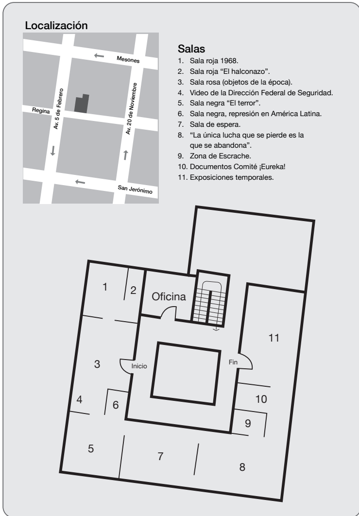
Figura 1 PLANO DE LA EXPOSICIÓN DEL MUSEO