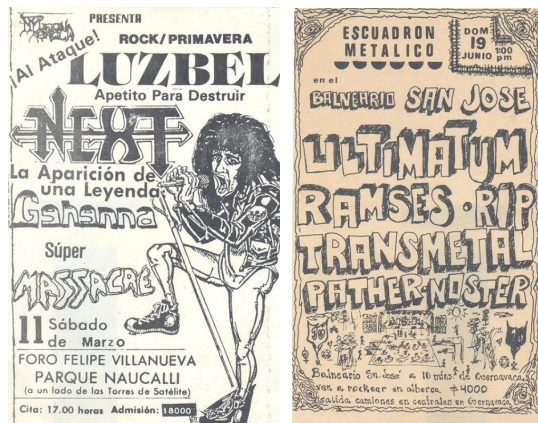
IMÁGENES 4 Y 5. PUBLICIDADES DE HEAVY .

En el caso de sus publicidades, también durante la primera etapa, se caracterizaron por una monotonía en blanco y negro.