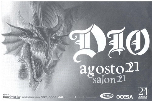
IMAGEN 15. PRESENTACIÓN DE DIO EL 21 DE AGOSTO DE 2004 EN EL SALÓN 21 EN LA AMPLIACIÓN GRANADA CON LA PARTICIPACIÓN DE OCESA Y TICKETMASTER EN LA ORGANIZACIÓN.

Nota: En la publicidad se pueden apreciar claramente diversos elementos ya señalados: la vinculación a las formas estéticas de magia pagana, la profesionalización del diseño, y la localidad en un sitio no popular ubicado a unas cuadas de una zona exclusiva de la CDMX.