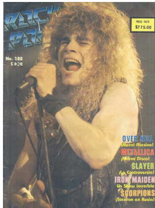
IMAGEN 3. PORTADA DEL NÚMERO 182 DE ROCK POP .