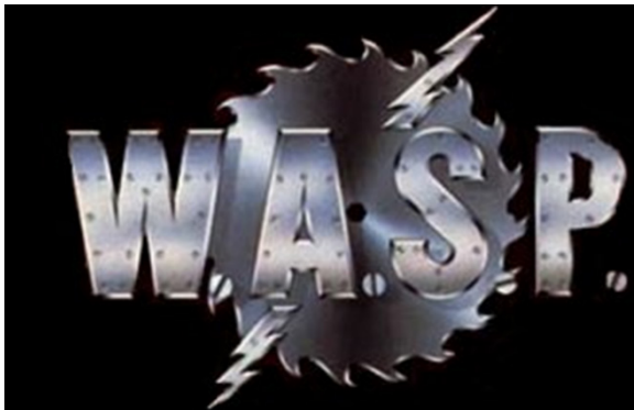
IMAGEN 1. LOGOTIPO DEL GRUPO W.A.S.P. 13

Puede ser que en México haya tenido algún efecto la campaña antidisco estadounidense, liderada por seguidores de rock en 1979 (Ramírez, 2009). El economista Francisco