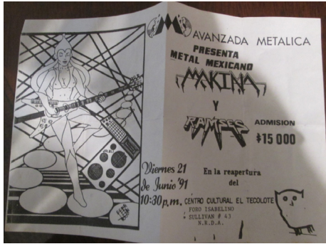
IMAGEN 14. PUBLICIDAD EN FORMA DE CUADERNILLO.