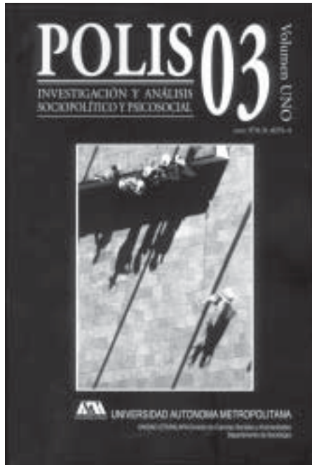
Polis. Investigación y análisis sociopolítico y psicosocial, núm. 3, vol. 1, Universidad Autónoma Metropolitana-Iztapalapa, México, 2003, 212 pp.