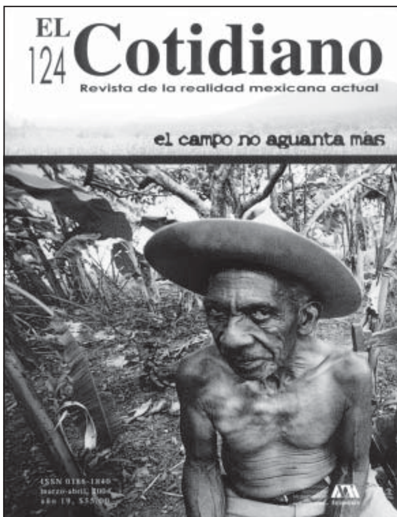
El Cotidiano , núm. 124, marzo-abril de 2004, Universidad Autónoma Metropolitana-Azcapotzalco, México D.F.