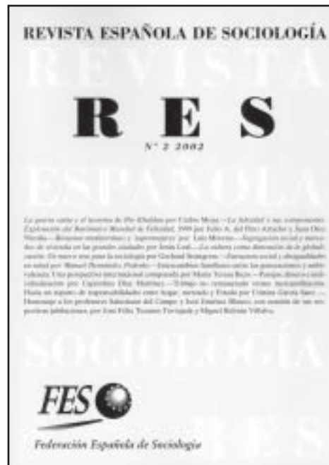
Revista Española de Sociología, núm. 2, Federación Española de Sociología, Madrid, 2002, 200 pp.