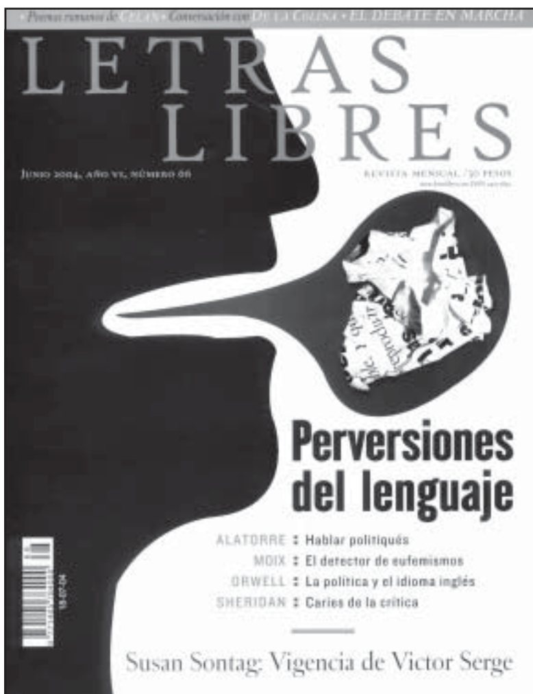
Letras libres , junio de 2004, Ed. Vuelta, Año VI, núm. 66, México D.F.