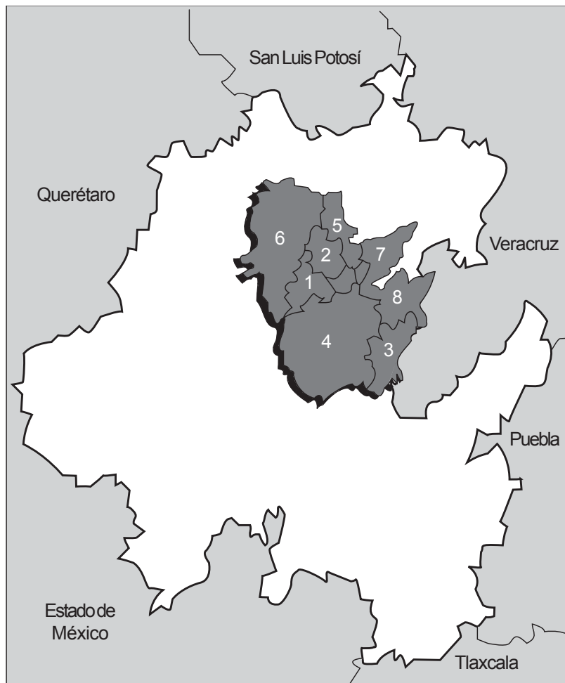
MAPA 1 MUNICIPIOS DE LA SIERRA HIDALGUENSE